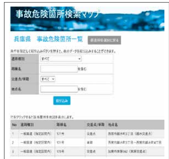
②事故危険箇所一覧から該当箇所を選択