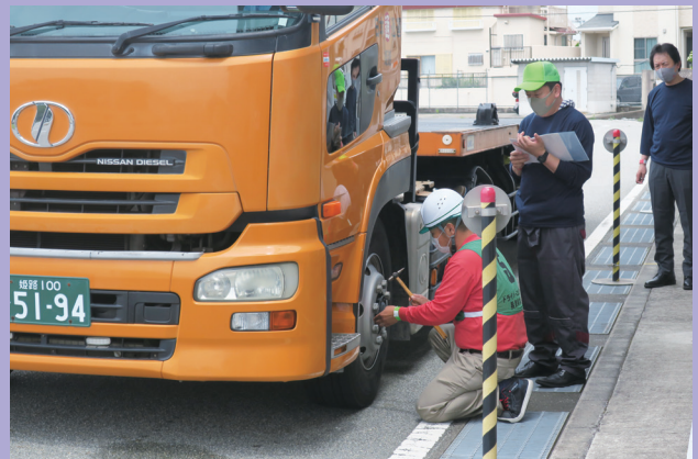
トラックドライバー・コンテスト