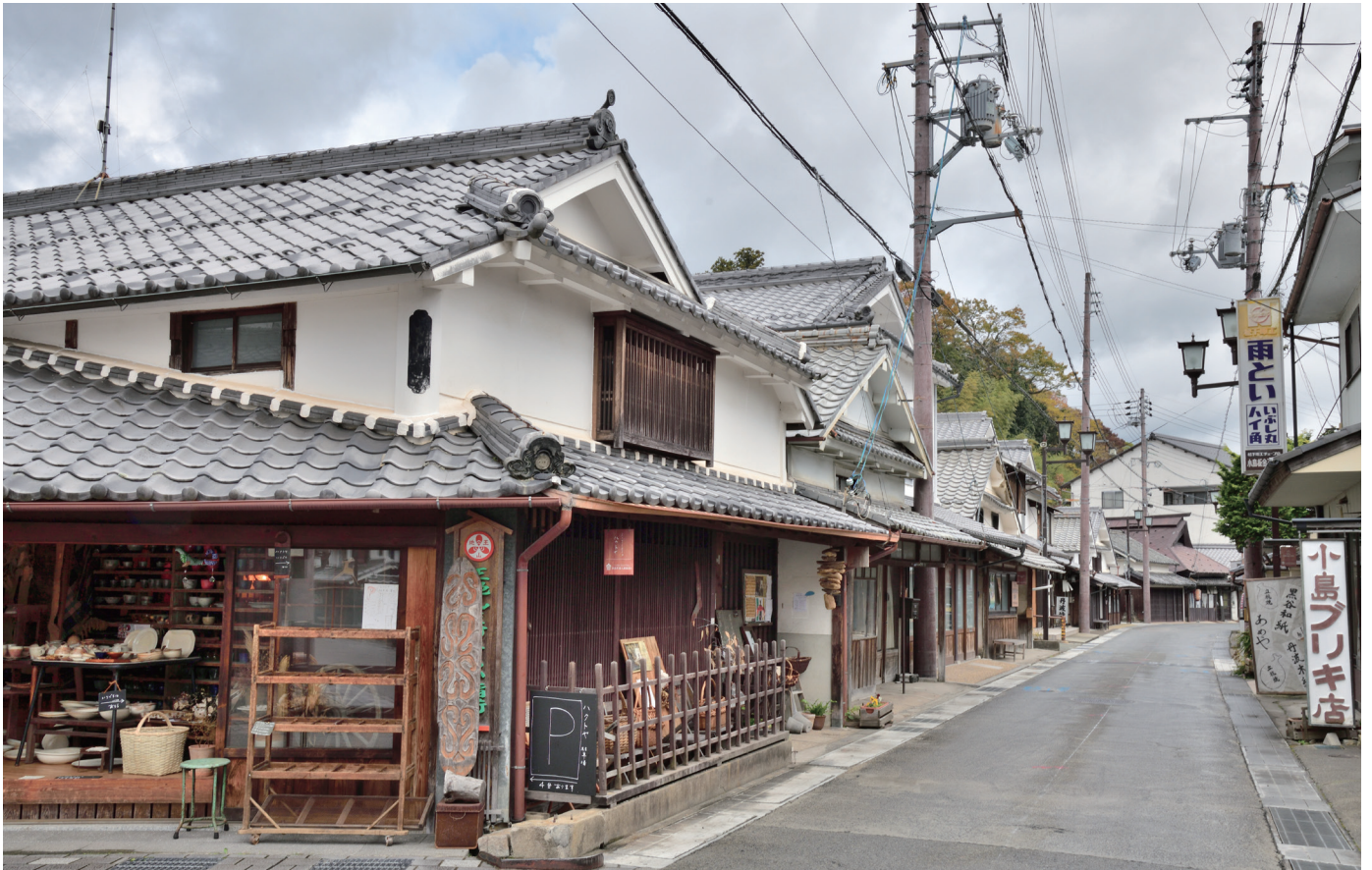
場所：篠山の街並み（丹波篠山市）