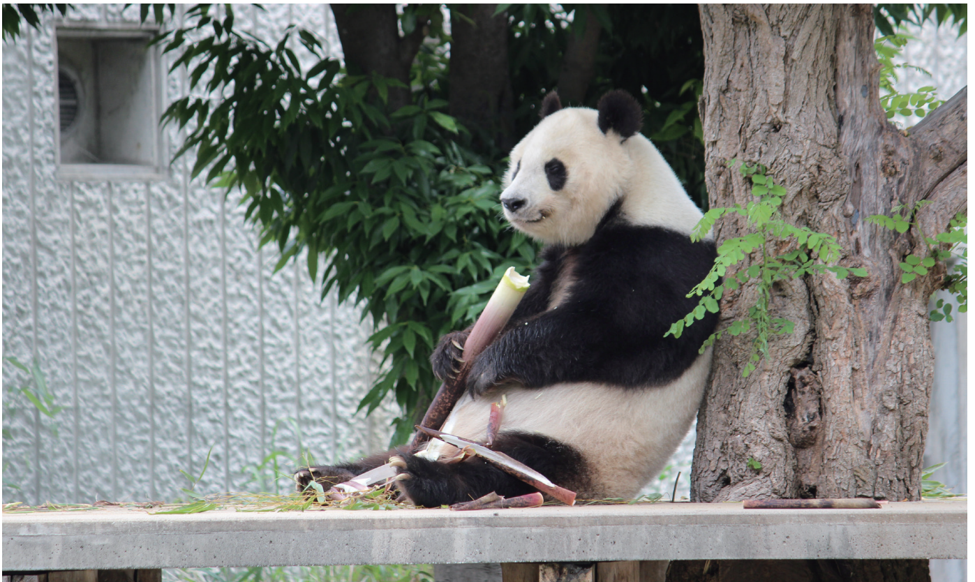
場所:王子動物園(神戸市灘区)