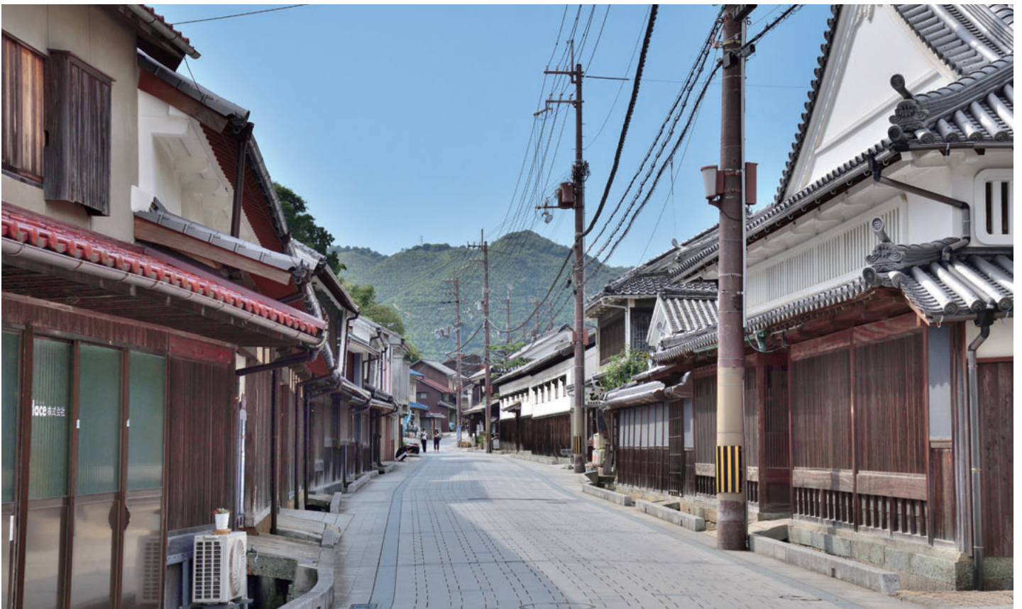
場 所：坂越の町並み(赤穂市)