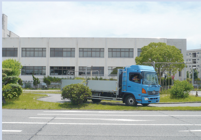
トラックドライバーコンテスト 兵庫県大会