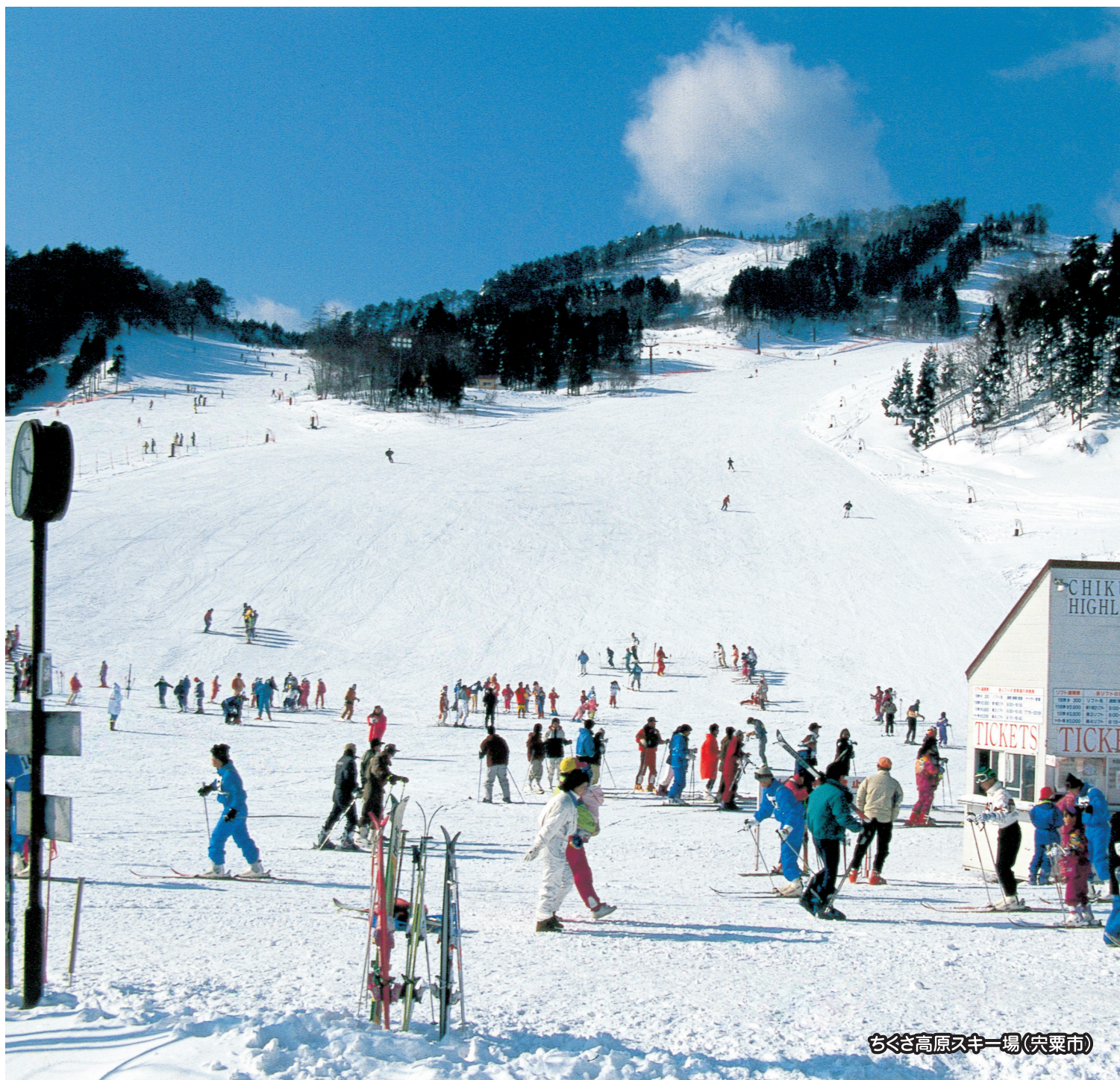
ちくさ高原スキー場(宍粟市)